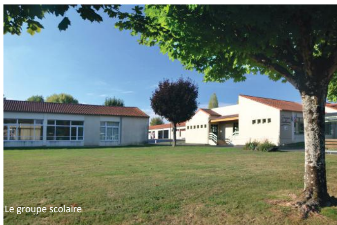
Le groupe scolaire

Face à l'explosion démographique, il fallait réaliser ici des équipements. Ce même automne 1973, le nouveau groupe scolaire sortait de terre derrière la ferme de la Briésérie et, cinq ans plus tard, un bureau de poste, une pharmacie, une salle polyvalente puis une superette.