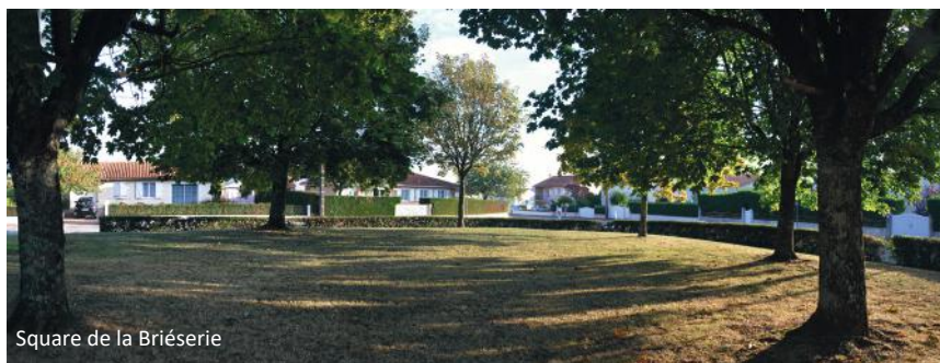
Square de la Brièserie

Envahie par la végétation jusqu'en 2015, la mare de la rue des Violettes fait partie des zones humides réhabilitées en compensation de la création de la zac de la Chaume aux bêtes. C'est un lieu de flânerie à découvrir et déjà apprécié pour l'évolution des maquettes du Modèle club (sauf en période de sécheresse !)