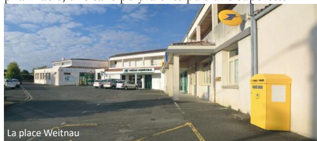
La place Weitnau

Face à l'explosion démographique, il fallait réaliser ici des équipements. Ce même automne 1973, le nouveau groupe scolaire sortait de terre derrière la ferme de la Briésérie et, cinq ans plus tard, un bureau de poste, une pharmacie, une salle polyvalente puis une superette.