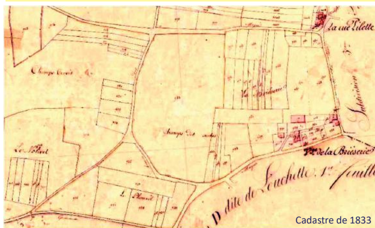
Cadastré de 1833