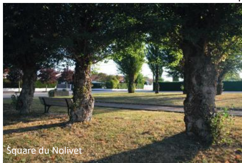
Square du Nolibet

Des lieux de calme et de rencontres ont été préservés.