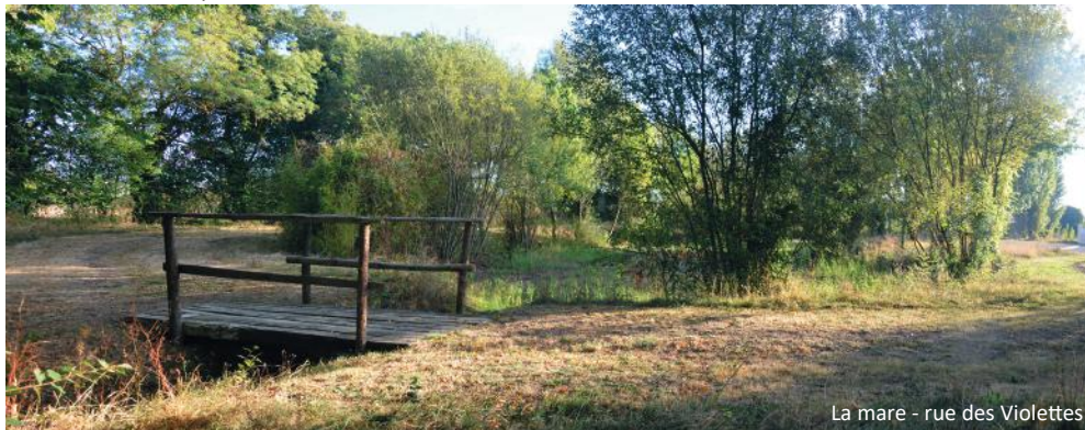
La mare - rue des Violettes

En mémoire de Maurice Marteau résistant dans le réseau Delbo Phoenix