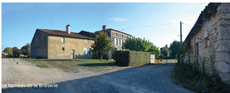
Le hameau de la Briésérie